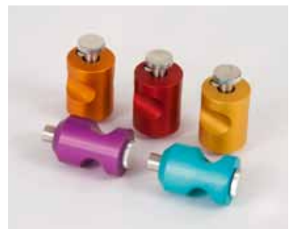
IGT 固定容量インキピペット