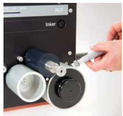
IGTインキピペットでインキを供給