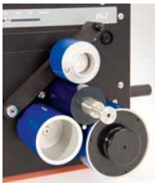
プリンティングディスクへの着肉

試験機の手前側に付いているプッシュボタンを使用して印圧をかけます。オレンジブルーファ 70では、様々な幅のプリンティングディスクを使用できます。この装置は特に、クレジットカード或いは最大印刷幅70mmの試験サンプル等に直接印刷するために設計されています。定期的に幅広印刷が必要な場合、ベストチョイスはオレンジブルーファ70です。